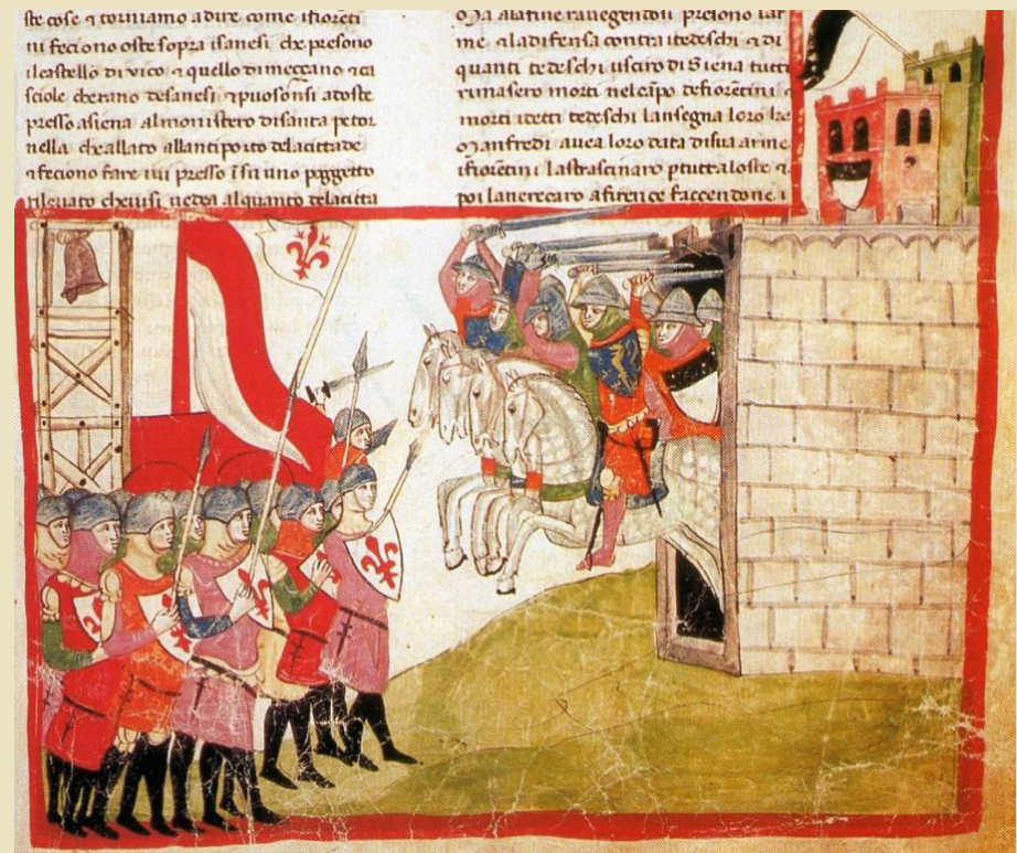
Battaglia di Montaperti miniatura