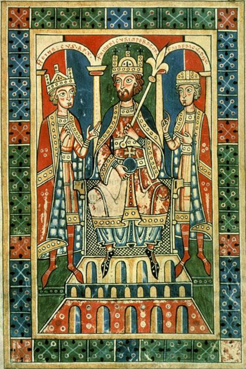
Federico Barbarossa con i figli Enrico VI e Federico (miniatura del 1320)

In medio plis refidet pater i o p p r i a l i s.