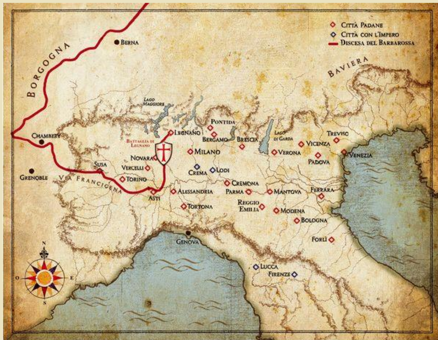
I Comuni della Lega Lombarda e l'itinerario di Barbarossa fino a Legnano