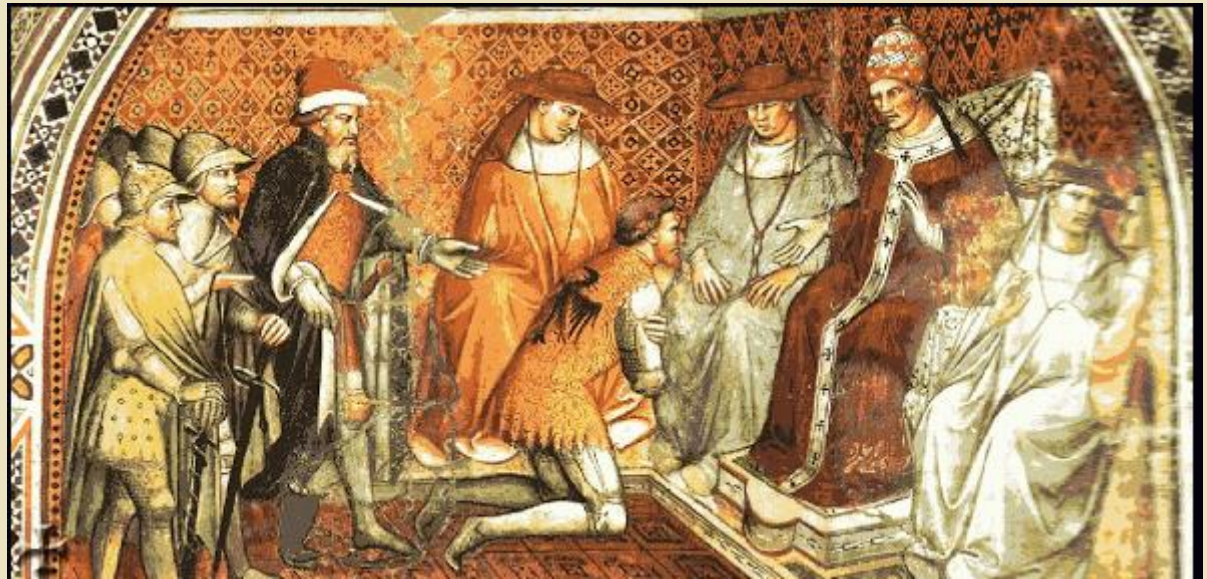
La sottomissione del Barbarossa a papa Alessandro III