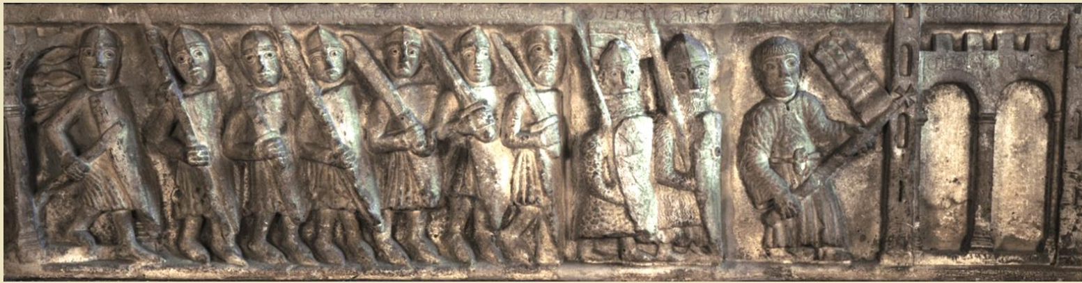
Le truppe milanesi rientrano nel Comune dopo l'esilio Rilievo del XII sec. dalla Porta Romana di Milano (ora ai Musei del Castello Sforzesco)