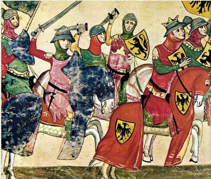
L'imperatore Enrico IV invade l'Italia per raggiungere Roma.