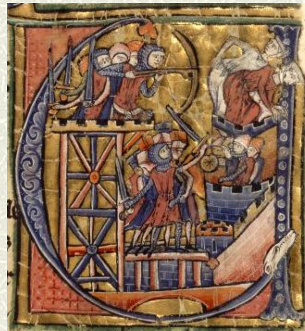
I Crociati conquistano Gerusalemme grazie ad una torre d'assedio (miniatura del XIII sec.)