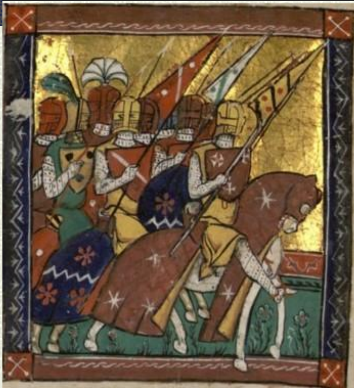
Goffredo di Buglione guida l'esercito (miniatura del XIII sec.)