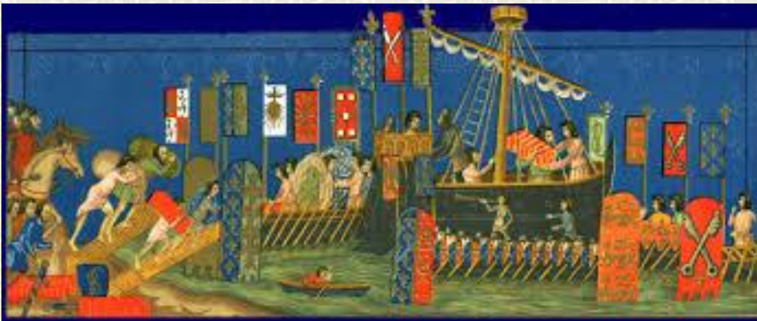
L'imbarco dei Crociati (miniatura del XIII sec.)