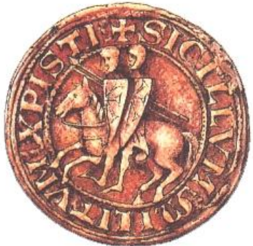
sigillo dei Templari

Nel 1307 il re di Francia Filippo IV il Bello, per impossessarsi dei beni dei Templari, li accusò di eresia e fece pressione sul papa perché sopprimesse l'ordine.