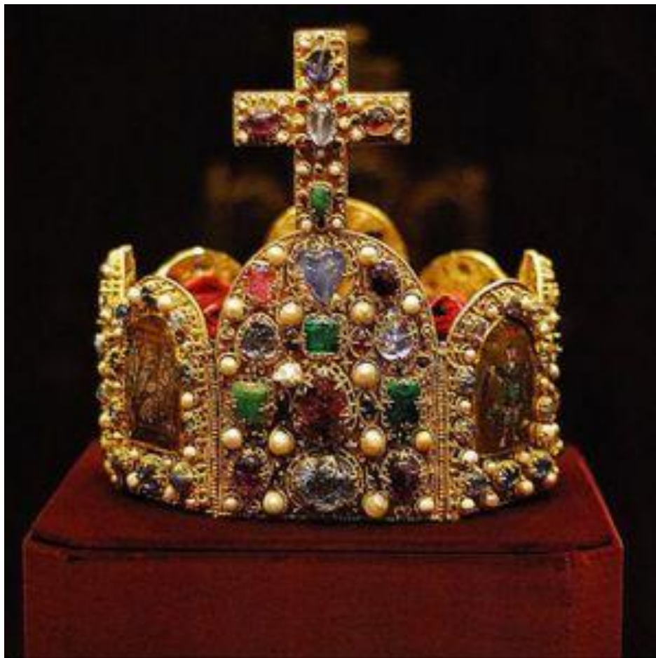
La corona di Ottone I, conservata ora a Vienna