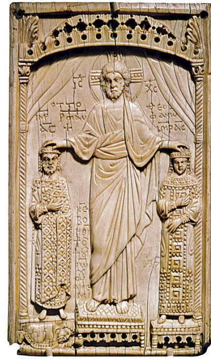
Ottone II e la moglie incoronati da Cristo 982-983 Avorio